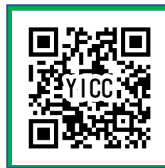
登録用二次元バーコード